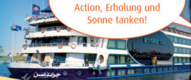
Claudia Unzeitig, ETI

Bei einer Nilkreuzfahrt verbinden Sie Kultur, Action, Erholung und Sonne tanken!