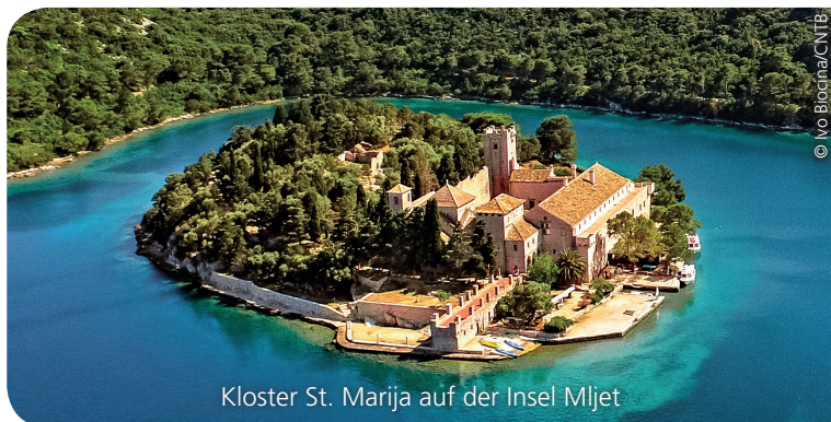
Kloster St. Marija auf der Insel Mljet