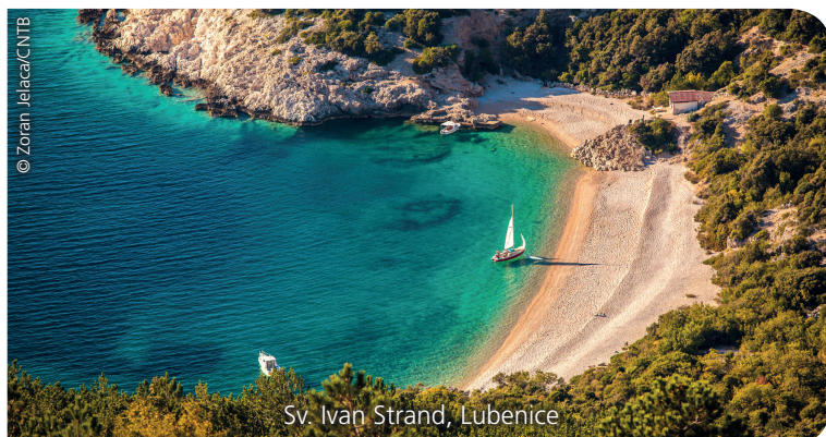
Sv. Ivan Strand, Lubenice